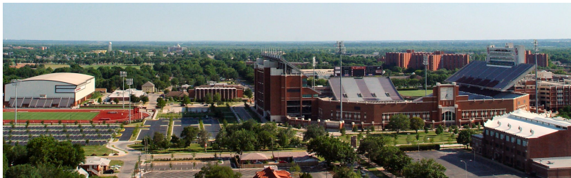
Überblick über den Campus