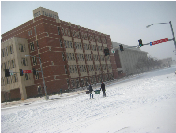
Norman im Winter